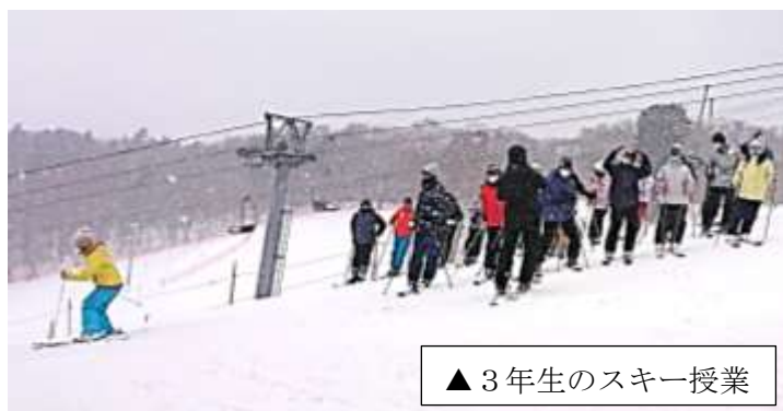
▲3年生のスキー授業

また今年度も紋別市スキー協会のご協力のもと、講師を3名～4名派遣して頂いています。今後とも、どうぞよろしくお願い致します。