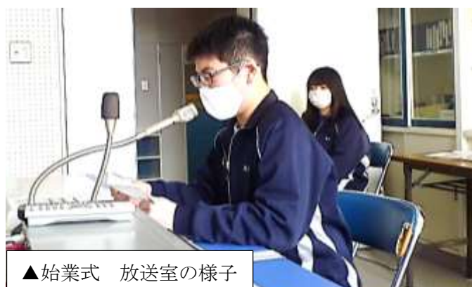
▲始業式 放送室の様子

3学期は1年間のまとめの学期であり、来年度への準備の学期になります。健康管理をしっかりとおこない、全校生徒で1年間の総まとめができるように期待しています。